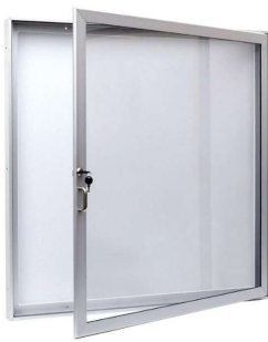
Vitrína (ilustrační obrázek)